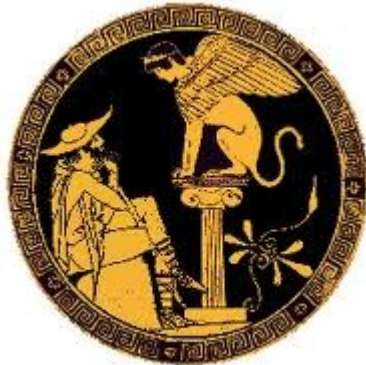
Illustration: le mythe d'oedipe. Ici oedipe assimilé a un Lion et assisté d'un ange..

Ensuite, Attaqué par un lion au cours de son voyage, en thessalie, il revient blessé à un pied. Marchant sur une jambe, il finit sa vie, apeuré d'avoir affaibli l'idéal patriarcal de thèbes.