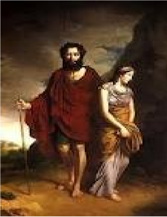
Illustra. oedipe et sa fille Aentigone.