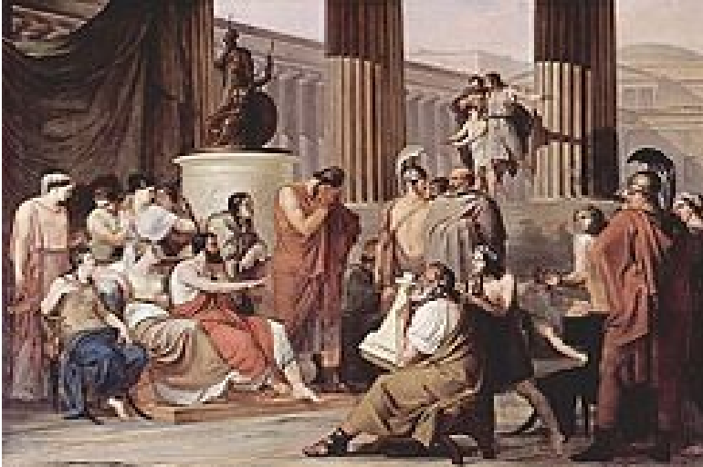
Ulysse au palais de Alkinoos . Peinture de Francesco Hayez

Sur son chemin vers le palais, Ulysse rencontre Athéna déguisée comme une petite fille locale. Athéna lui conseille clairement sur la façon d'entrer dans le palais, qui est gardé par des chiens mécaniques en argent et or, construit par Héphestos . Le palais est entouré par des murs de bronze qui «brillent comme le soleil» , garanti par des portes d'or. Dans les murs il ya un magnifique jardin avec des arbres qui poussent toutes sortes de fruits, des poires, des grenades, et des pommes, toute l'année. Le palais est même équipé d'un système d'éclairage composé de statues dorées de jeunes hommes avec des torches allumées dans leurs mains pour donner de la lumière pendant la nuit. Après son à travers la ville, on lui dit d'entrer dans le palais et de plaider la clémence de la reine Arete. Ulysse, couverte d'un nuage de camouflage fournies par Athéna, passe par tous les systèmes de protection du palais et pénètre dans la chambre du roi Alkinoos. Il jette ses bras autour des jambes de la reine et les appels à elle. Naturellement, Alkinoos et sa cour ont été surpris de voir un étranger à la marche dans leur palais sécurisé, mais offrent immédiatement l'hospitalité et de l'aider dans son voyage.