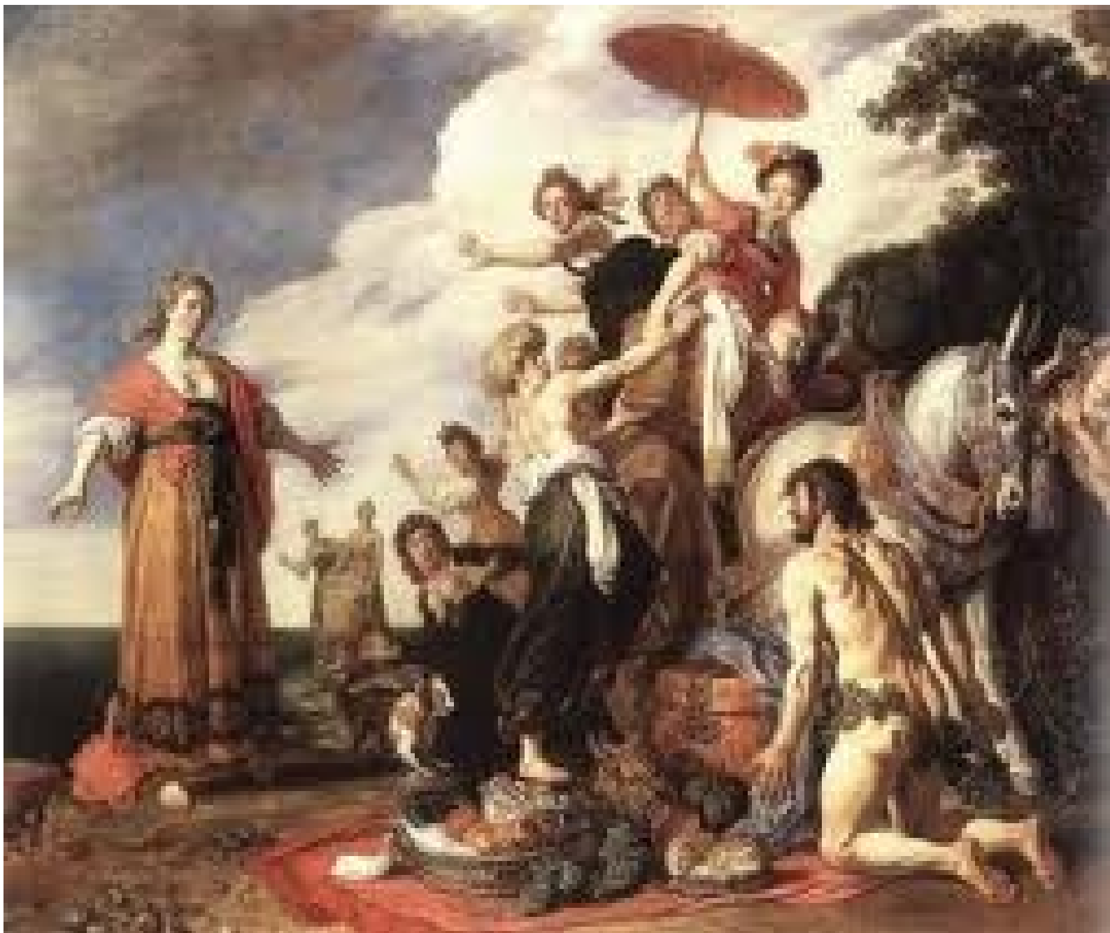
Illustration 1: le pays des phéaciens!

Alors, le roi Alcinoos, toujours Oedipe, lui ordonne de faire amende honorable, alors Laodamas il donne à Ulysse une épée de bronze avec une poignée d'argent et une gaine d'ivoire.